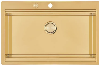
Évier Milanello Gold workstation 1034 059