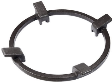
Support de Wok en fonte 9601 727