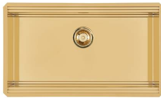
Évier Milanello Gold Workstation 1034 859