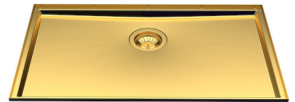
Évier Phantom Base Gold 5557 149